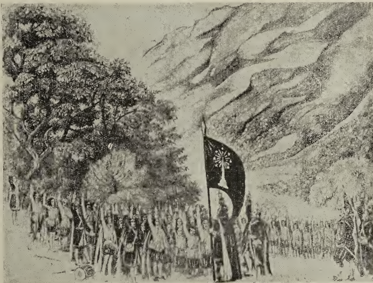
EL JURAMENTO DE SIBAUD

de volver a él a pesar de todos los pesares, y a cualquier precio. Ese anhelo nunca se extinguió en el corazón de los míseros expatriados. Ya lo tenían al franquear las puertas de las cárceles y los límites de los Valles para emprender el peregrinaje del destierro, y cada día que pasaba él iba creciendo en